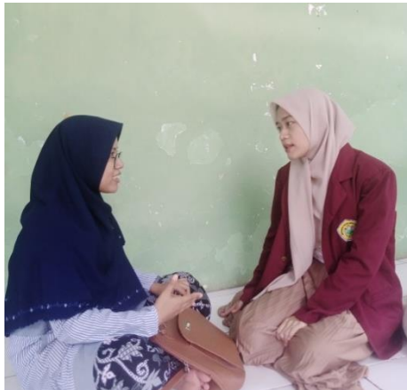
Gambar 2. Wawancara Secara Langsung

“...setelah mencoba saya merasakan pahit manisnya menjadi guru. Dimana gaji seorang guru sangat tidak mencukupi kebutuhan malah mengeluarkan biaya lebih. Jadi sangat berat untuk menjadi guru. Bukan hanya masalah finansial yang tidak seberapa namun realita kita mempunyai banyak kebutuhan hidup yang harus dipenuhi.”