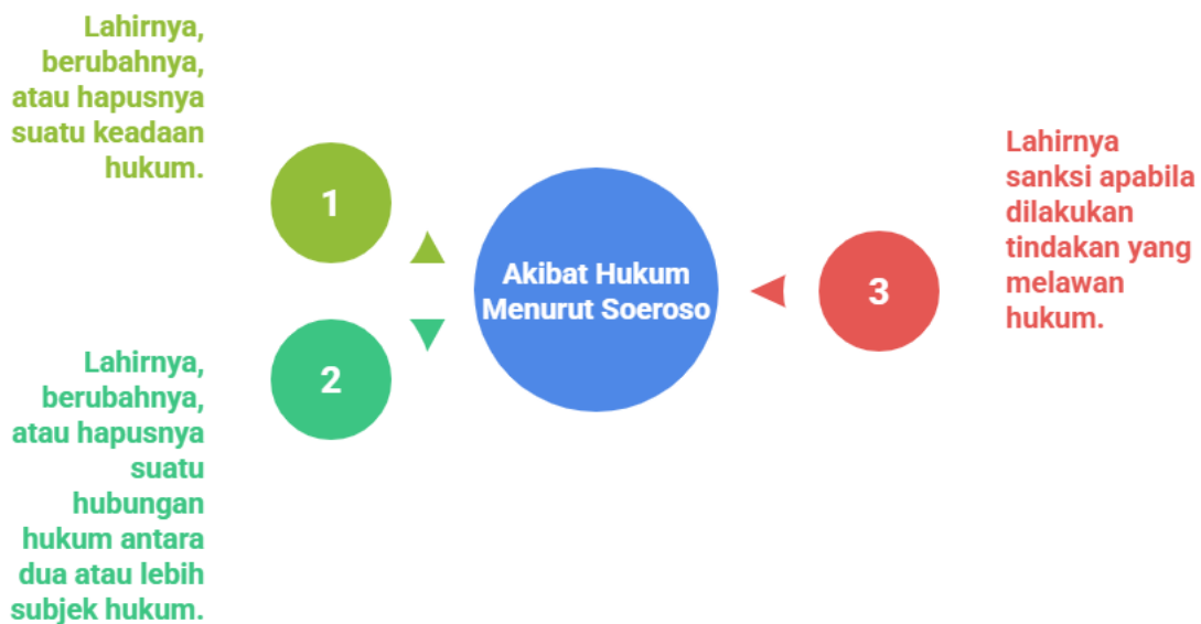
Figure 1. Bentuk akibat hukum menurut Soeroso

Teori akibat hukum menurut Soeroso dapat memberikan landasan teoritis yang kuat dalam memahami berbagai konsekuensi hukum yang timbul dari perbuatan melawan hukum oleh PPAT. Hal ini menegaskan bahwa setiap tindakan hukum harus dilakukan dengan itikad baik dan penuh tanggung jawab, karena setiap pelanggaran terhadap norma hukum akan menimbulkan akibat hukum yang tidak hanya berdampak pada status pelaku, tetapi juga pada kepentingan hukum pihak lain serta ketertiban umum.