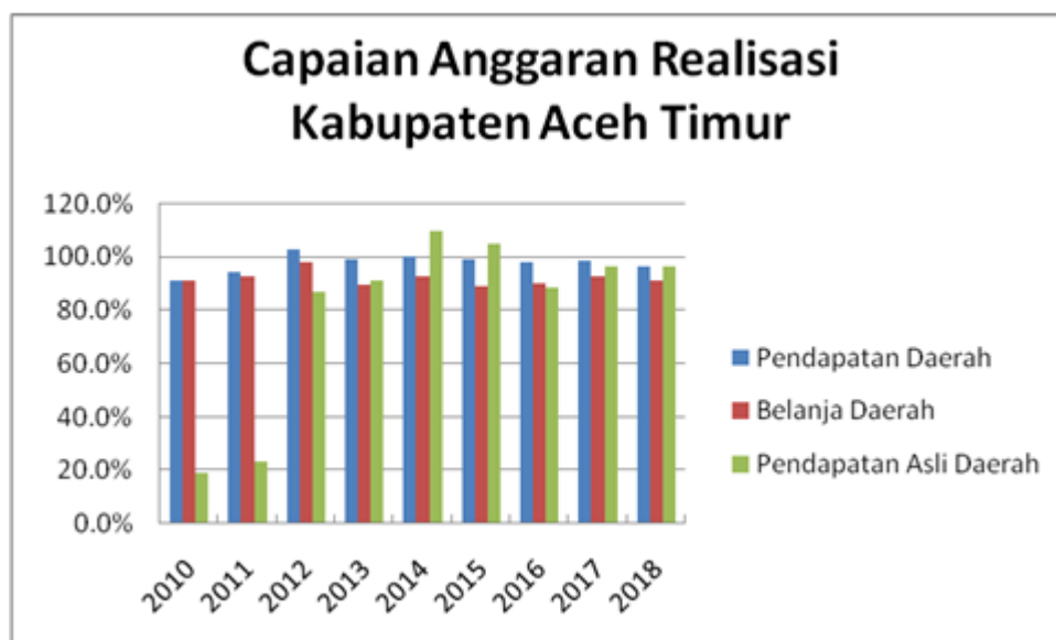
Gambar 4.1. Capaian Anggaran Realisasi Kabupaten Aceh Timur Tahun 2010-2018 Sumber: Laporan Realisasi Anggaran, BPKD Kabupaten Aceh Timur, 2019, (diolah)

Berdasarkan gambar 4.1 menunjukkan grafik capaian anggaran realisasi Kabupaten Aceh Timur bahwa pendapatan daerah berupa dana perimbangan yang bersumber dari transfer umum, transfer khusus, hibah dan otonomi khusus memiliki kinerja kurang baik, ditunjukkan dari hasil rata-rata tingkat capaian anggaran dan realisasi pendapatan daerah dari tahun 2010 sampai dengan 2018 masih dibawah target