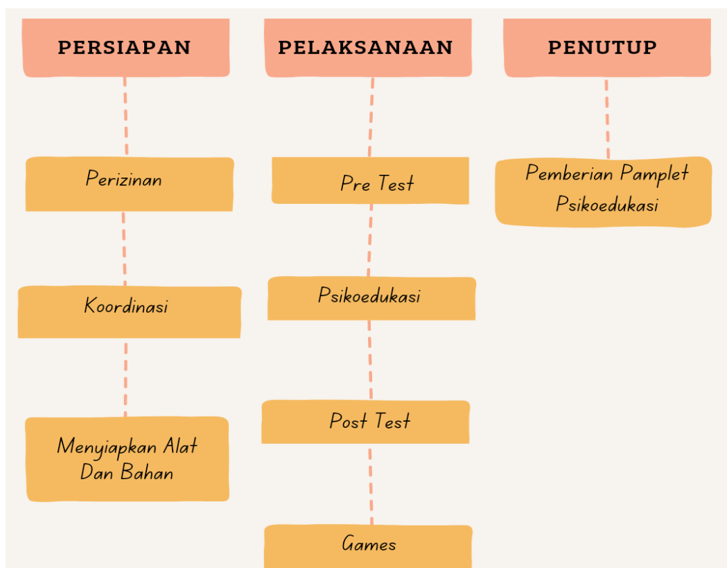
Gambar. 1 Alur Kegiatan Psikoedukasi

bullying . Dengan ini, diperoleh data dari hasil test yang selanjutnya dapat dianalisis untuk menentukan tingkat pemahaman siswa-siswi Madrasah Ibtidaiyah Al-Istiqamah. Data yang terkumpulkan melalui kuisioner kemudian di olah dan di kategorikan. Untuk pengkategorian tingkat pemahaman responden menggunakan hasil pengukuran mean dan standar deviasi terhadap skor jawaban responden. Yang dibuat dengan 3 kategori yaitu baik, sedang dan kurang. Sebagai penutup kegiatan, hasil pelaksanaan program kerja pengabdian masyarakat berupa peningkatan aspek pemahaman tentang bullying . Berdasarkan hasil tersebut, diperlukan tindak lanjut dari pihak sekolah untuk tetap melakukan edukasi terhadap siswa dan siswinya.