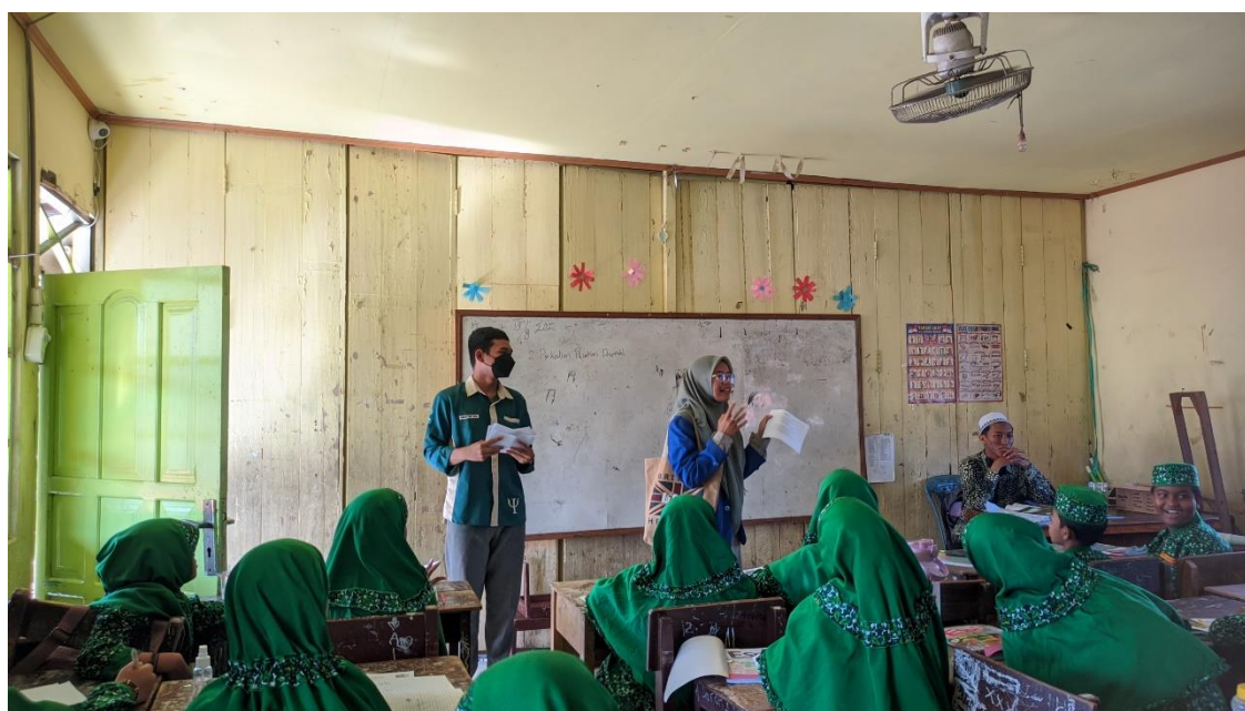
Table 1. Dokumentasi Kegiatan Psikoedukasi MI Al-Istiqamah Banjarmasin

Dokumentasi kegiatan dalam program pengabdian masyarakat di ilustrasikan pada table 1.