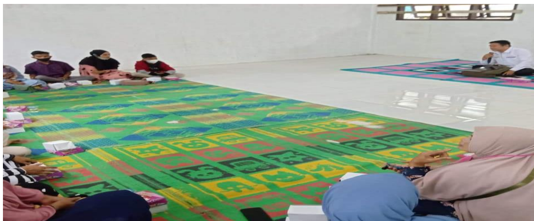
Gambar 2. Penyuluhan bagi masyarakat

Penyuluhan yang diberikan kepada masyarakat bertujuan untuk merubah pola pikir masyarakat. Penyuluhan tidak sekedar menginformasikan, tetapi sekaligus mengedukasi masyarakat, sehingga berubah dari keadaan yang tidak baik ke arah yang lebih baik.