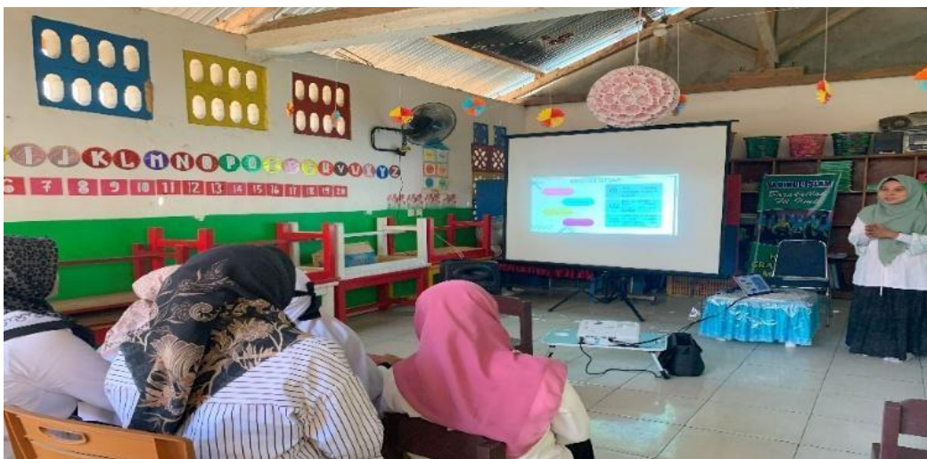
Gambar 1. Pemaparan materi oleh narasumber