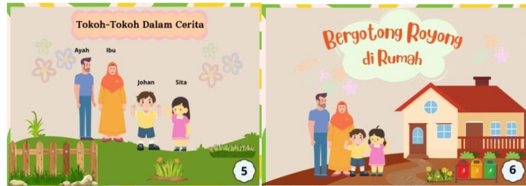
Gambar 5 tokoh dalam cerita bergotong royong di rumah

Pada gambar 4 tentang daftar isi buku media cerita bergambar yang didalamnya mencantumkan 2 capaian pembelajaran yakni bergotong royong di rumah dan sekolah.