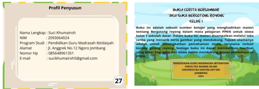
Gambar 9 halaman penutup

pekerjaan yang dilakukan bergotong royong dengan tidak bergotong royong dan agar peserta didik mengetahui manfaat bergotong royong.