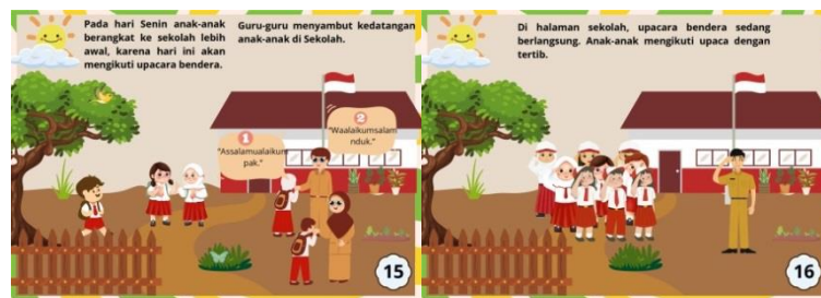
Gambar 7 isi bergotong royong di sekolah

Pada gambar 7 menceritakan tentang bergotong royong di rumah, yang dimulai dari satu keluarga berbagi tugas bergotong royong membersihkan ruang tamu, ruang tengah, kamar tidur dan dapur. Halaman tentang bergotong royong di rumah terdiri dari 6 halaman dari halaman 7-13.