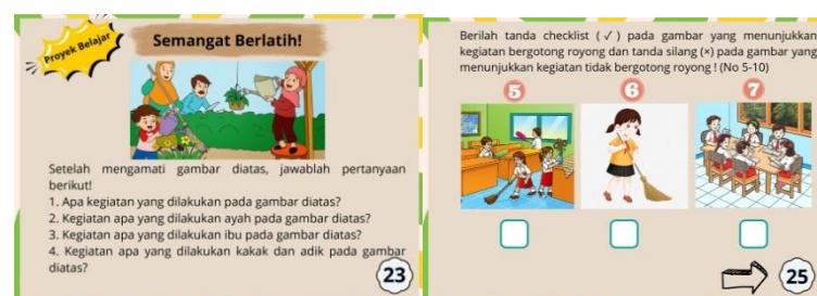
Gambar 8 Latihan soal

Pada gambar 7 menceritakan tentang bergotong royong di sekolah, yang dimulai dari siswa siswi berangkat sekolah, pelaksanaan upacara bendera, selanjutnya diberikan tugas bergotong royong membersihkan halaman sekolah dan masing-masing kelas. Halaman tentang bergotong royong di sekolah terdiri dari 7 halaman mulai halaman 15 sampai 21.