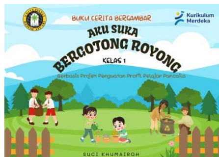
Gambar 1 Cover Buku cerita bergambar

Selanjutnya tahap design (desain), pada tahap ini peneliti menyiapkan perancangan terhadap produk yang akan dikembangkan yaitu media cerita bergambar. Penyusunan media ini disesuaikan dengan tujuan pembelajaran pada materi bergotong royong yaitu menunjukkan peran setiap anggota keluarga dalam kehidupan sehari-hari dan mengklasifikasikan nilai-nilai gotong royong dan peran setiap anak dalam bergotong royong. Produk didesain menggunakan platform Canva yang menghasilkan dokumen sebanyak 28 halaman, produk media cerita bergambar yang telah selesai siap dicetak menggunakan kertas ukuran A4. Jenis kertas yang digunakan adalah art paper 310gr untuk bagian sampul dan 210gr untuk isi buku cerita (isinya full colour). Selanjutnya, produk akan dijilid dengan spiral dan siap digunakan atau diterapkan dalam pembelajaran. berikut desain media buku cerita bergambar yang didesain.