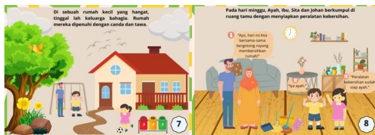
Gambar 7 isi bergotong royong di rumah

Gambar 6 berisi halaman depan tokoh dalam cerita bergotong royong di sekolah