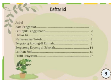
Gambar 4 halaman daftar isi

Pada gambar 3 berisi tentang petunjuk penggunaan media cerita bergambar. Petunjuk ini diharapkan memudahkan siswa dalam mempelajari dan menggunakan buku sesuai tujuan pembelajaran sehingga dapat mencapai tujuan pembelajaran yang diharapkan peneliti.