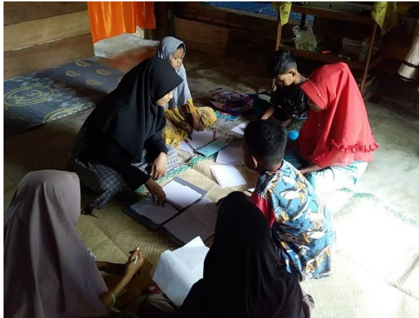
Gambar 2. Penjelasan tentang metode bersusun pada perkalian.