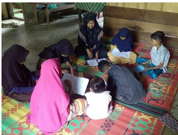
Gambar 5. Pertemuan Kelima

Pada pertemuan kelima dan keenam, pendamping memberikan latihan soal pada siswa. Tujuan dari pemberian soal ini yaitu untuk melihat sejauh mana siswa dapat memahami materi yang sudah dijelaskan pada beberapa hari sebelumnya. Pada pertemuan kelima dan keenam, pendamping memberikan latihan soal pada siswa. Tujuan dari pemberian soal ini yaitu untuk melihat sejauh mana siswa dapat memahami materi yang sudah dijelaskan pada beberapa hari sebelumnya.