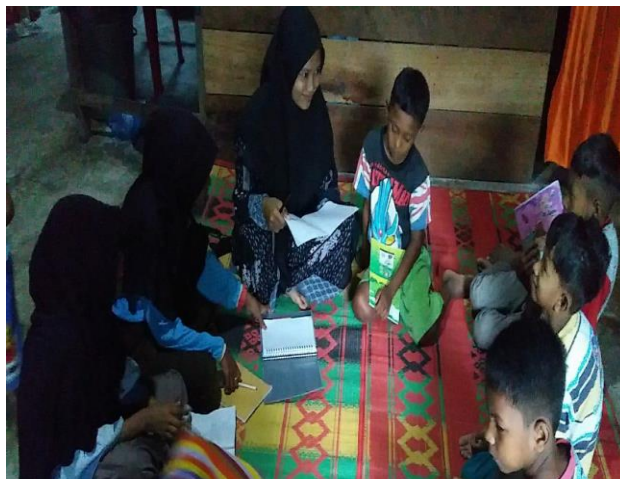
Gambar 7. Pertemuan Ke-tujuh

Pada pertemuan ke-tujuh, pendamping memberikan permainan hitung cepat kepada siswa yang mana soal yang diberikan yaitu tentang perkalian dengan metode bersusun kemudian pendamping meminta siswa untuk menjawabnya secara cepat dan tepat. Tujuannya yaitu untuk melihat minat siswa dalam menjawab soal dan juga untuk melihat seberapa cepatkah siswa dalam menjawab soal yang diberikan.