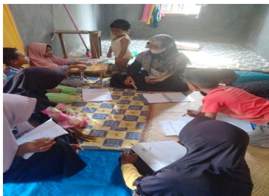
Gambar 1. Kegiatan pengenalan pada pertemuan pertama.

Pada pertemuan pertama, pendamping memperkenalkan diri sekaligus memperkenalkan materi perkalian yang akan diajarkan dengan metode bersusun. Pendamping menunjukkan contoh-contoh perkalian dengan metode bersusun. Tujuan perkenalan pada pertemuan pertama ini adalah agar siswa dapat mengenal dan mengetahui tentang gambaran materi yang akan dipelajari dipertemuan berikutnya.