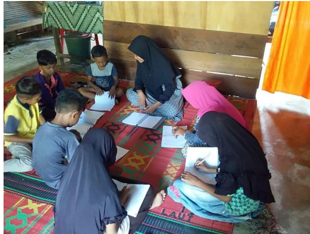
Gambar 6. Pertemuan keenam