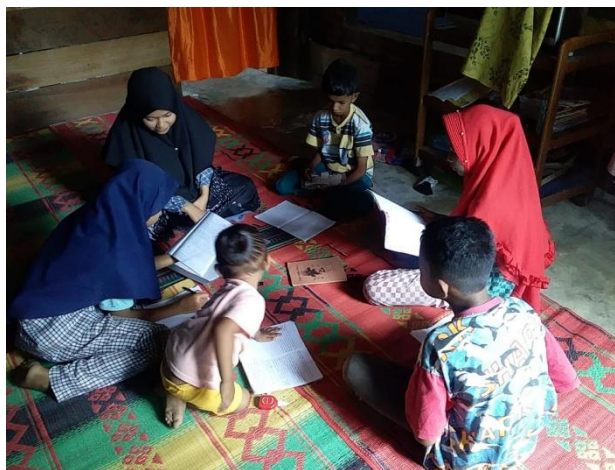
Gambar 3. Pertemuan ketiga

Pada pertemuan ketiga dan keempat, pendamping memberikan beberapa contoh soal untuk memperlihatkan pada siswa tentang bagaimana langkah-langkah dalam menyelesaikan perkalian dengan metode bersusun yang sudah dijelaskan pada pertemuan sebelumnya.