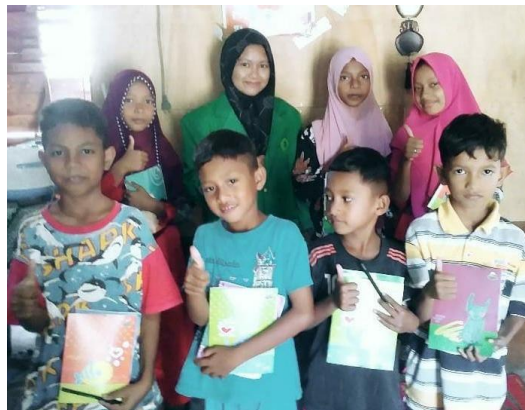
Gambar 1. Foto bersama siswa di Desa Cinta Raja.

Hasil yang dicapai pada kegiatan pengabdian masyarakat adalah siswa dapat memahami bahwa metode bersusun dapat digunakan sebagai metode belajar dengan mudah dan cepat, khususnya dalam proses pembelajaran perkalian. Kegiatan yang dilakukan dalam pengabdian masyarakat ini yaitu bimbingan belajar tentang cara mudah dan cepat belajar perkalian dengan menggunakan metode bersusun di Desa Cinta Raja.