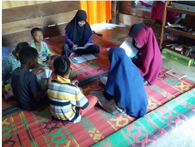
Gambar 4. Pertemuan ke-empat