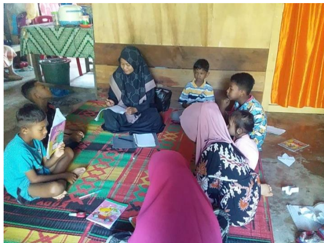
Gambar 9. Pelaksanaan evaluasi pembelajaran

Pada pertemuan kedelapan pendamping melakukan evaluasi pembelajaran untuk melihat sejauh mana siswa dapat memahami materi perkalian dengan menggunakan metode bersusun. Evaluasi dilakukan dengan cara memberikan beberapa soal yang berbeda dengan setiap siswanya. Hal ini dimaksudkan agar siswa dapat menjawab sendiri soal yang diberikan sesuai dengan kemampuan yang dimilikinya.