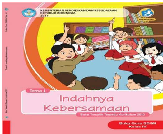
Gambar 1. Buku Tematik Kelas IV Tema Indah Kebersamaan

Buku teks dasar, menengah, dan perguruan tinggi. Selanjutnya, disebut buku teks adalah buku referensi yang harus digunakan pada satuan pendidikan dasar dan menengah atau perguruan tinggi yang memuat materi pembelajaran dalam rangka meningkatkan keimanan, ketakwaan, akhlak dan kepribadian yang mulia, penguasaan ilmu pengetahuan dan teknologi, peningkatan kepekaan dan kemampuan estetika, peningkatan kemampuan kinetik dan kesehatan yang disusun berdasarkan standar nasional pendidikan (Rahmah, 2018).